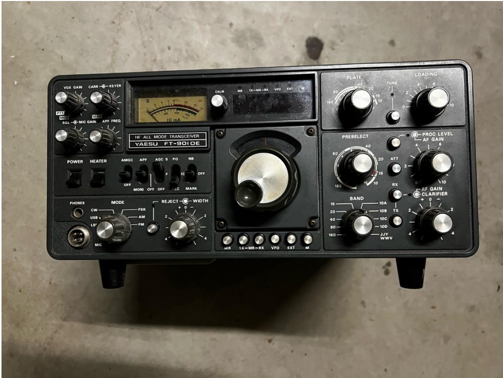
Kavel A - Yeesu FT 901DE transceiver en tafelmicrofoon YD 148